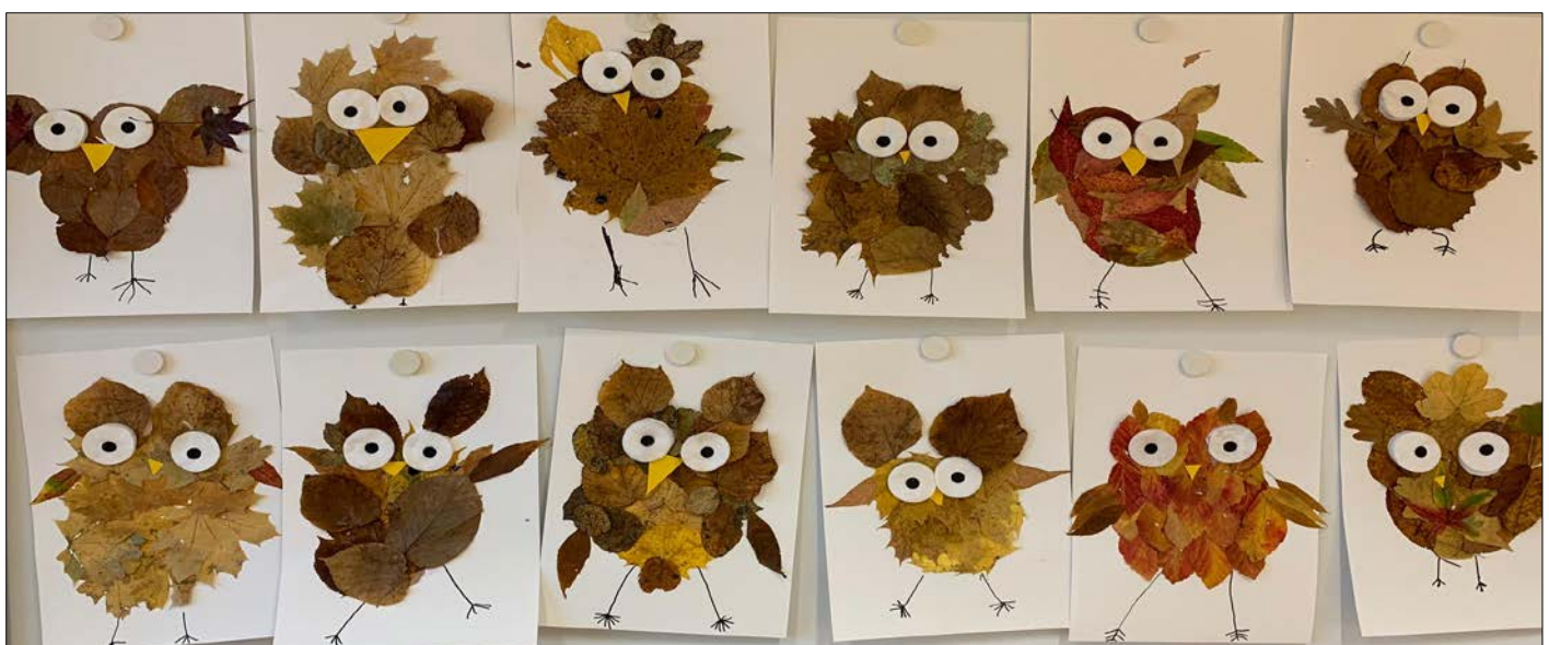
Abbildung | Arbeiten aus dem Bildnerischen Gestalten 1b

* Am Mittwochnachmittag, 13. April 2022, 25. Mai 2022 und 15. Juni 2022 findet Unterricht statt.