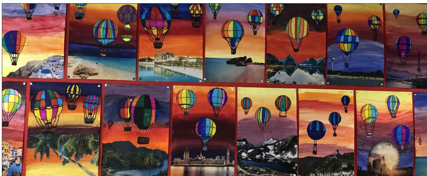
Abbildung | Arbeiten aus den Projekttagen Mittelstufe I

* Am Mittwochnachmittag, 05. April 2023, 17. Mai 2023 und 07. Juni 2023 findet Unterricht statt.