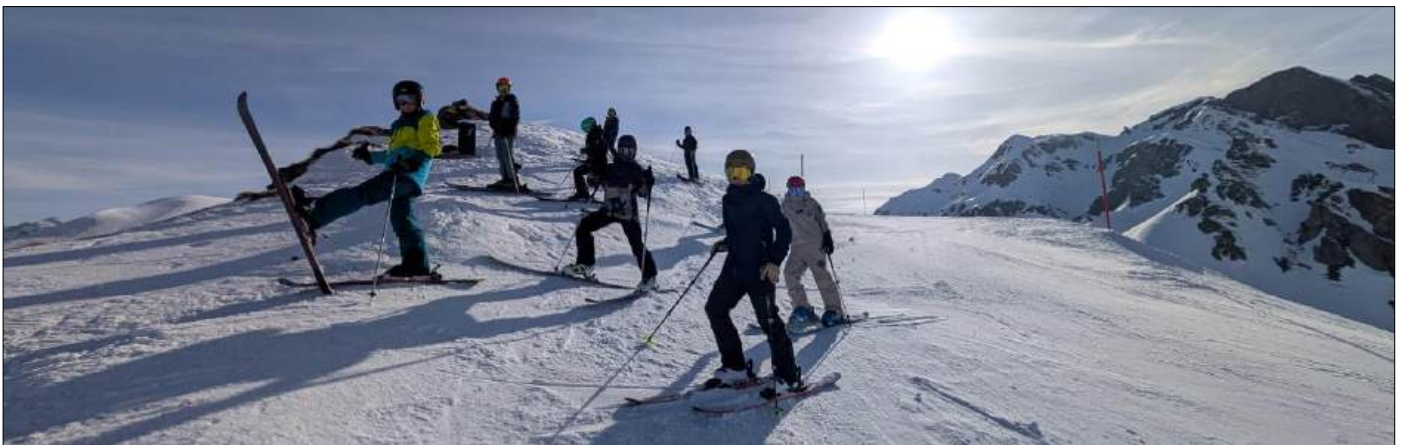
Abbildung | Schulverlegung 6. Klasse

Gemäss Krankenkassenversicherungsgesetz ist es Sache der Eltern, ihre Kinder ausreichend gegen Unfall zu versichern. Normalerweise erfolgt dies über die private Krankenkasse. Die Schule hat für die Schüler/innen keine Unfallversicherung.