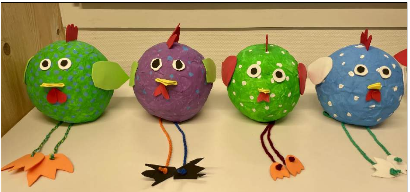
Abbildung | Arbeit aus dem Bildnerischen Gestalten, 2. Klasse

* Am Mittwochnachmittag, 23. Dezember 2026, 24. März 2027 und 26. Mai 2027 findet Unterricht statt.