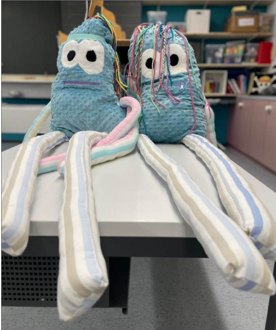
Abbildung | Arbeit aus dem textilen Gestalten, 5. Klasse