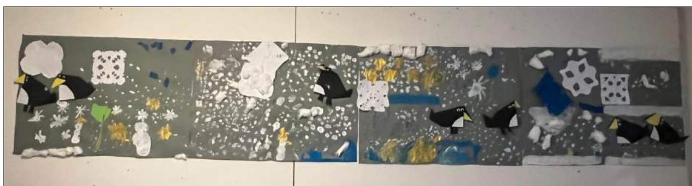
Abbildung | Arbeiten aus dem KIGA