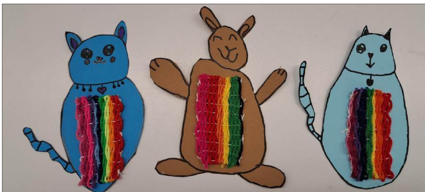
Abbildung | Arbeit aus dem Bildnerischen Gestalten, 1. Klasse

* Am Mittwochnachmittag, 12. April 2028, 24. Mai 2028 und 14. Juni 2028 findet Unterricht statt.