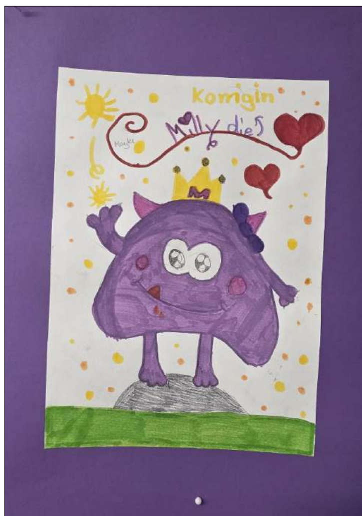
Abbildung | Arbeit aus dem Bildnerischen Gestalten, 3. Klasse