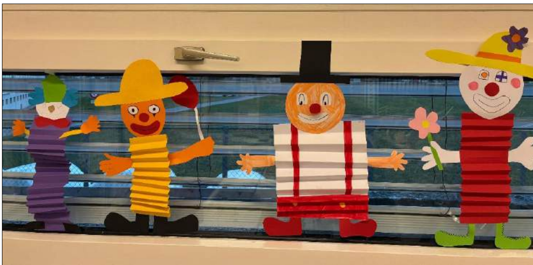
Abbildung | Arbeit aus dem Bildnerischen Gestalten, 4. Klasse